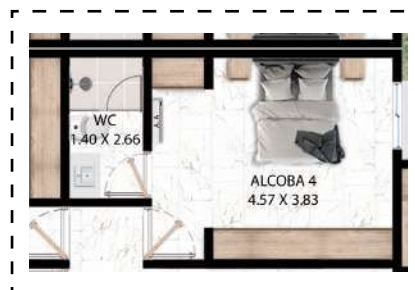
Opción 4ta alcoba

Área construida: 129 m 2 Área privada construida: 115,2 m 2 Área privada libre: 13,4 m 2